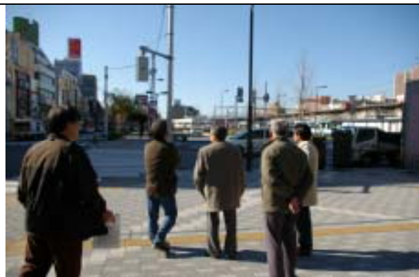
葛飾区・金町駅南口 5,400 m 2