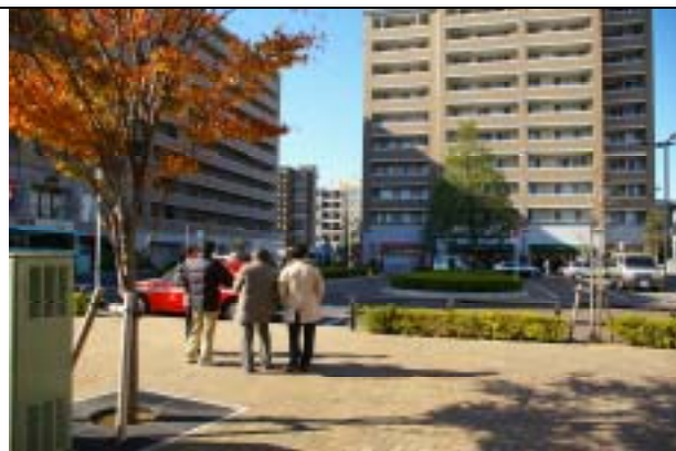
江戸川区・一之江駅環 7 口 3,600 m 2