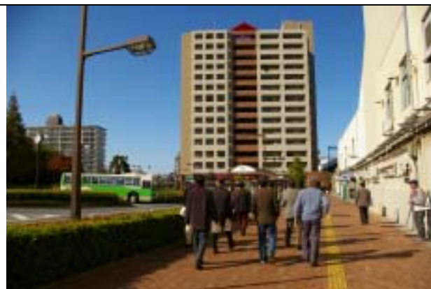
江東区・東大島駅大島口 5,640 m 2

今後もこのような見学会を行い、具体的な拝島駅南口駅前地区の将来の町のあるべき姿を検討する参考にしていきたいことが重要だと考えます。