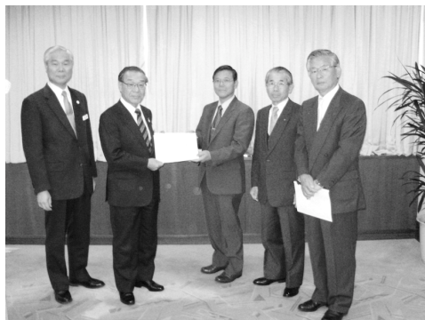
昭島市長への提出の様子