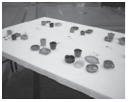
▲昨年の作品展から

●陶芸教室作品展 7月に開催した陶芸教室で小学生が作製した作品と、ボランティア講師の作品を展示します。 日時 8月18日(月)～22日(金)の午前8時30分～午後5時(22日は午後4時30分まで) 場所 市役所市民ロビー (社会教育係)