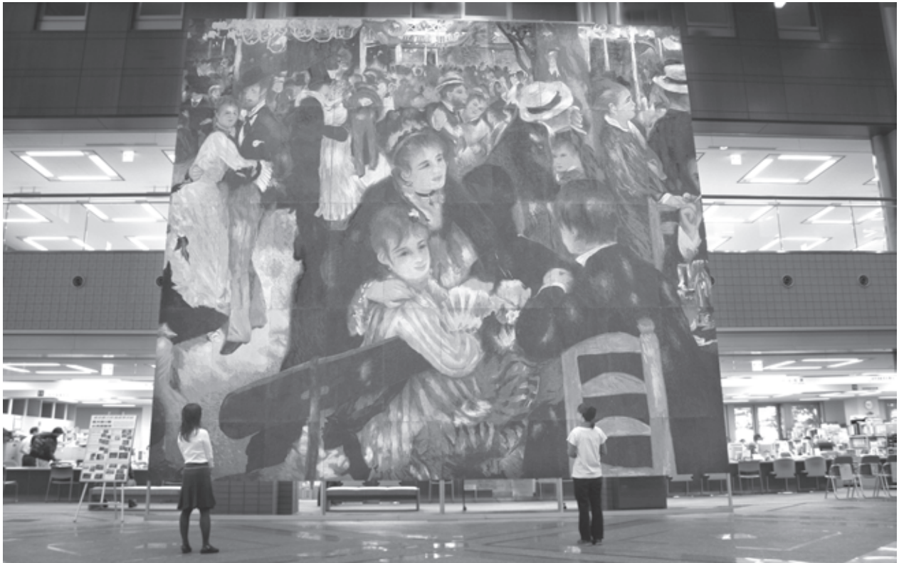
都立拝島高校の生徒たちによる巨大貼り絵(ルノアール「ムーラン・ド・ラ・ギャレット」) ※12月19日まで(土曜・日曜を除く午前8時30分～午後5時)市役所市民ロビーで展示しています。