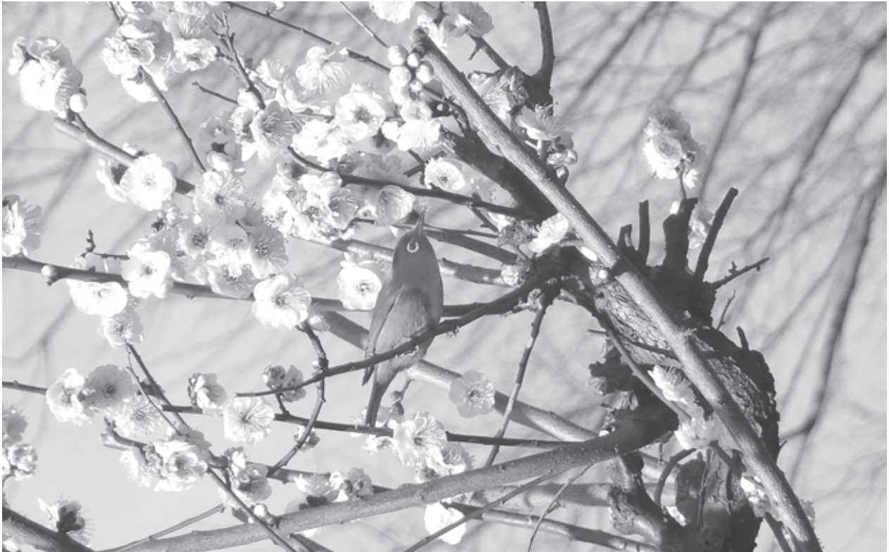
春の訪れを待ちます