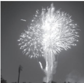
▲今年もやります!「夢花火」