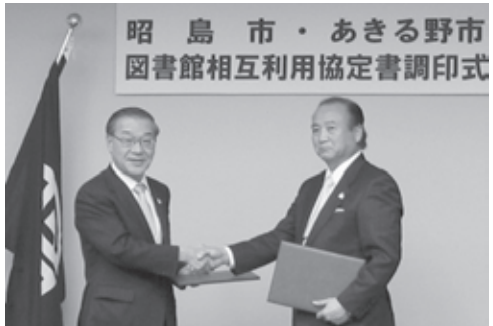
▲あきる野市と図書館相互利用協定を締結