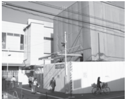
▲現在工事中の拝島駅南口