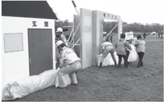
▲今年の水防演習は5月17日に実施予定