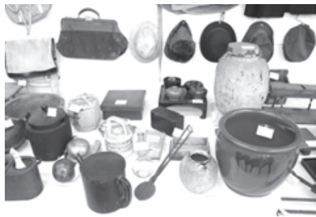
▲市民の方から寄贈された民具

摩川の鮎釣りの道具などを展示しています。 夏休みには延長して開室する期間も設けています(10ページを参照)。今後も文化財を市民共有の財産として、市民の皆さんと協力しながら保護していきます。 (次回は、9月1日号です。)