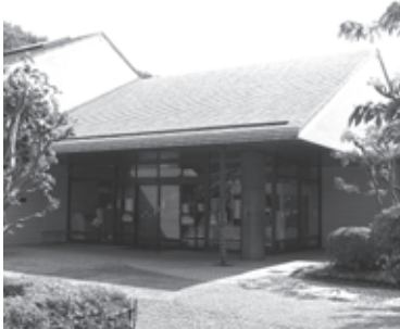
▲福生市中央図書館