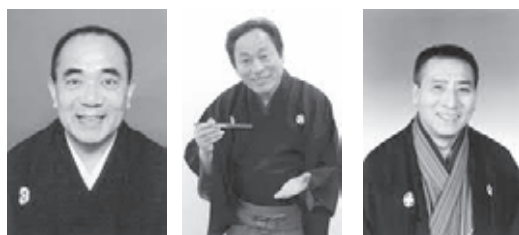
▲三遊亭小遊三 ▲桂 米助 ▲春風亭小柳枝

■第60回昭島寄席「新春初笑い」 1月24日(日)午後2時開演 大ホール(全席指定)/3000円 出演:三遊亭小遊三、桂米助、春風亭小柳枝ほか 《無料保育サービス》 1歳以上の未就学児(10人以内)の保育を受け付けます(申込順)。申し込みは、1月10日までに市民会館へ。