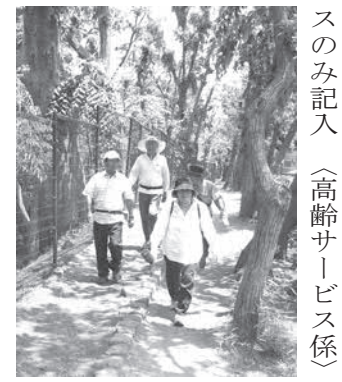
スのみ記入 (高齢サービス係)

●高齢者イキイキ・ニコニコ介護予防教室 左の表のとおり行います。期間 10月～12月(全12回) 対象 65歳以上の健康な方 定員 各15人(初めての方優先/多数抽選) 参加費 各1000円(材料費別) 申込はがきに左の表の希望コースの番号と、住所・氏名・年齢・電話番号を記入し、9月15日(必着)までに、次のあて先へ郵送 ▼①～⑩ 〒196-0022 中神町 2-32-18 シルバー人材センター「イキイキ・ニコニコ教室係」 ▼⑪～⑬ 〒196-0022 中神町 1-256-5-110 NPO法人ひだまり「イキイキ・ニコニコ教室係」 注意 コースは複数選択可、ただしはがきは1人1枚につき1コースのみ記入 (高齢サービス係)