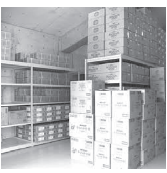
▲美堀備蓄倉庫の内部