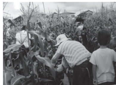
とうもろこしの背は 私たちより高いんだね

最初に野菜のとり方を教えていただいた後、みんなで収穫します。日常では体験できないので、みんな、楽しそうです。また、採れた野菜は、各家庭に持ち帰り、おいしく食べました。