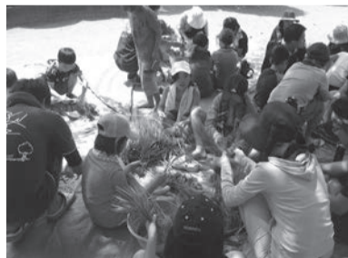
りっぱに育ってね