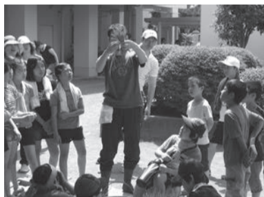
真剣にお話しを聞きます

4月に大勢の子どもたちや保護者・先生方の参加で種まきを終え、6月には2年生と5年生の児童が、学年活動として田植えを行いました。5・6年生は、苗の束ねからのお手伝いです。子ども達は、広い田んぼで汗をかき、泥んこになりながら、田植を楽しんでいました。一年を通して多くの地域の大人たちも参加されて行われている大きな活動です。