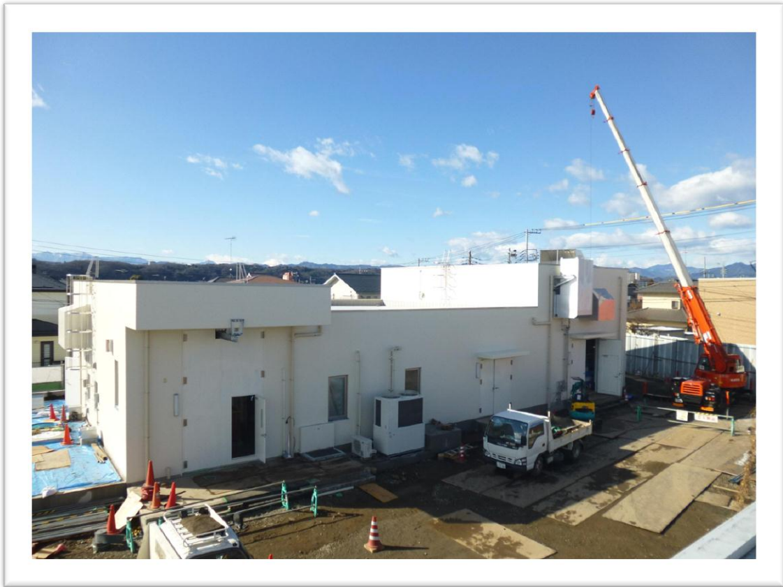
(西部配水場 新ポンプ棟建設の様子)