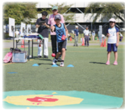
よ〜し チャレンジ (市民スポーツ・レクリエーションフェスティバル)

質問 長時間労働は正に内容策定し、7月から労働時間の縮減に向けた取り組みを開始した。今後も可能な実施は。②市内小・中学校における教職員の長時間・過密労働の是正に向けて、現在の社会情勢に鑑み、市の取り組みは。教員定数の増員こそ必要と考える。③市内公共工事に従事する建設現場労働者の実態は。