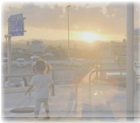
きれいな夕日だね (拝島駅南口)

質問 CV-22オスプレイの横田基地配備について、不安、危険、迷惑などの声が数多く寄せられている。①配備通告に対する見解は。②配備の目的は。③騒音対策として、低周波音測定器を購入すべき。④安全対策を自治体の長として国に要請すべき。⑤日米合同委員会の合意事項を米側に遵守してもらうための対応は。答弁 ①国と地方の役割分担から、判断する立場にな