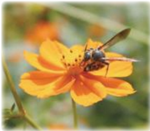
甘い匂いに誘われて (キバナコスモス)

質問 保育園の待機児解消について、①今年4月1日時点での待機児童数は35人だが、9月1日時点での人数は。また、その理由は。②来年度以降の計画は。③8月1日現在、50人。途中退園等がない限り、1歳児の募集がないことなどが要因と考