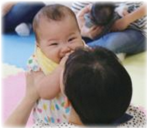
ママと一緒に (ベビーマッサージ・児童センター)

質問 熱中症による救急搬送者数が過去最多を更新し、学校も必ずしも安全な場所と言いつても状況と異なる中、どのように児童生徒の命を守っていくのか。①基本的な考え方は。②授業で体育館を使用する際、使用可否を決める判断基準と熱中症対策はどのようになっているのか。③放課後子ども教室における対応は。④体育館へのエアコン設置について、必要性に対する認識と導入の考えは。