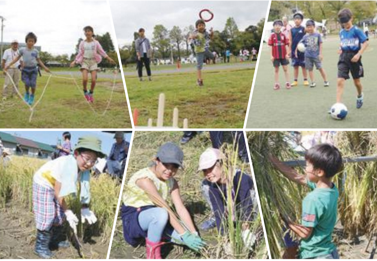
▲スポーツの秋 実りの秋 (上段:市民スポーツ・レクリエーションフェスティバル 下段:親子米づくり教室)

平成30年第3回昭島市議会定例会が、8月31日から10月3日までの3日間を会期として開かれました。市長から提出された議案17件が可決、同意及び認定され、一般質問は4日間にわたり14人の議員が行いました。