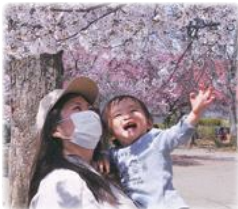
わあすごーい (昭和公園)

質問 道路整備と交通安全対策について、①市道昭島9号(文化通り)は傷んでいる箇所がある。補修する考えは。②市道東107号の富た。引き続き、路面状態や交通状況を注視していく。③昭島警察署と連携を図り、待機児童ゼロへ向けた取り組みは。④従前から教室の