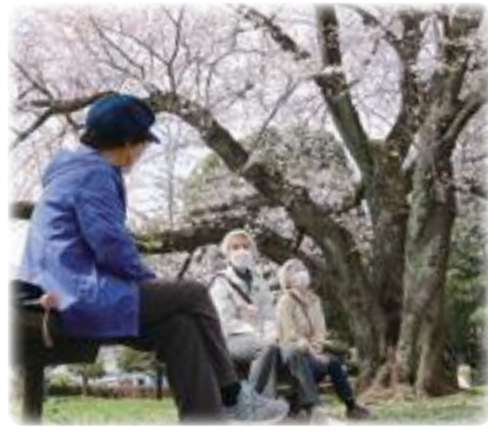
桜を見ながらおしゃべり (みほり広場)

質問 新型コロナウイルス感染症対策については、広報紙での呼び掛けが行われているが、これまでの市内での感染状況、年代別感染状況、重症者数や死亡者数なども併せて周知することにより、更なる注意喚起を求めている。次世代自動車への切り替えなどを実施していく予定である。②世代に応じた情報プラットフォームの使い分けや発信内容も含め、効果的かつ戦略的な情報発信に努めていきたい。 答弁 市の広報紙やホームページ等を活用し、感染症の状況を的確に捉える中で、感染拡大防止対策等の注意喚起に努めてきた。重症者数、死亡者数は把握している。③敷地内から道路上にはみ出す樹木や雑草などは、所有者や管理者が適切に管理すべきと考える。道路管理者としての対応は。④清掃ボラン