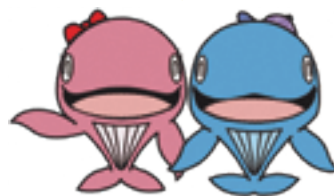
昭島市公式キャラクターアイラン&アッキー