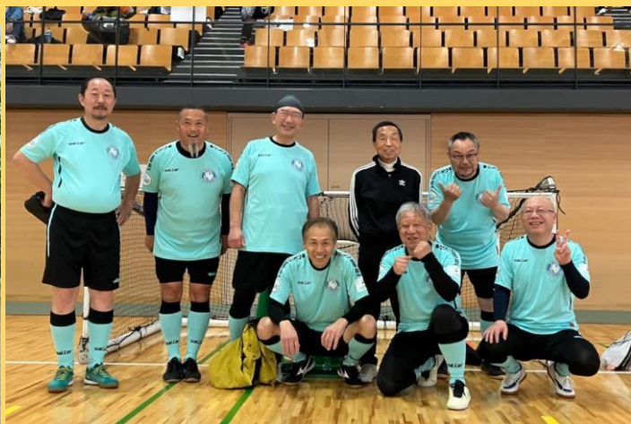
八王子で開催されたウォーキングフットボールの大会へ参加した際の集合写真