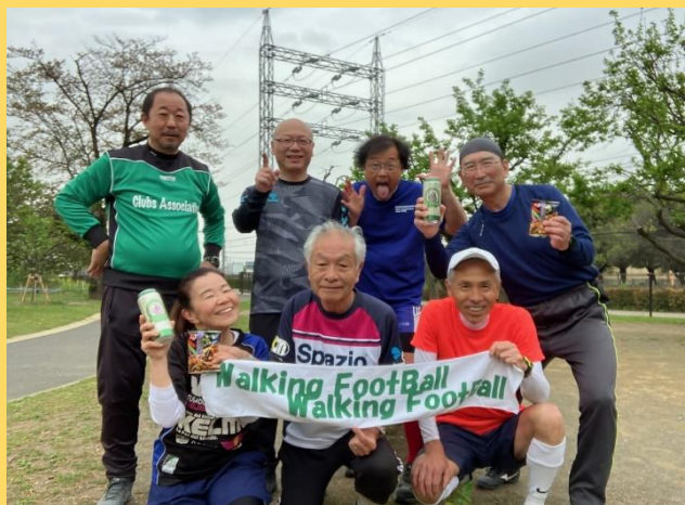
練習会後の集合写真、会場は昭島市エコ・パーク

ワンポイントレッスン（テーマのあるウォーミングアップ）の後、ゲームを楽しみます。ワンポイントレッスンではサッカーの基本技術のみならず、頭の体操にもなるコーディネーション・トレーニングも実施！上手にできなくてもOK、挑戦する姿勢が大切であり、脳を活性化させます。