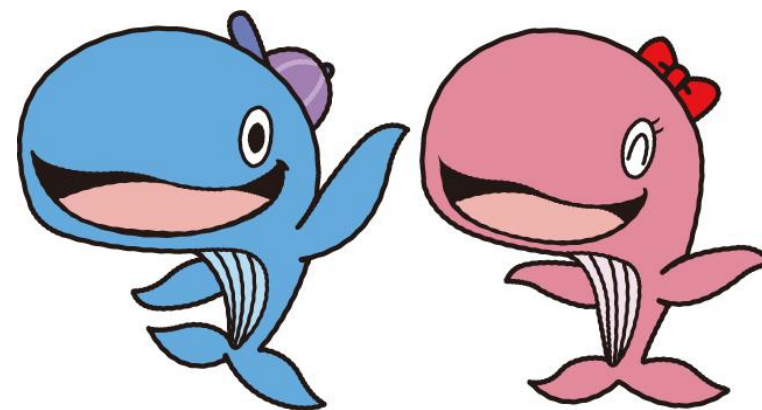
昭島市公式キャラクター アッキー&アイラン