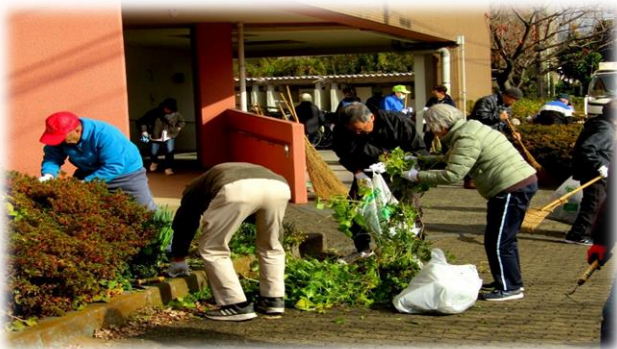
高齢者福祉センターの除草作業