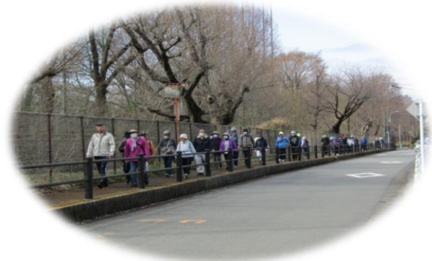
健康ウォーキング