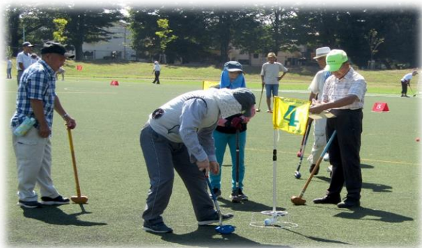
グラウンド・ゴルフ大会