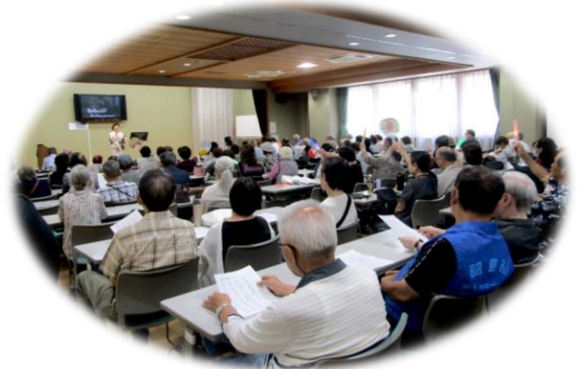
お楽しみ“うたごえ喫茶”