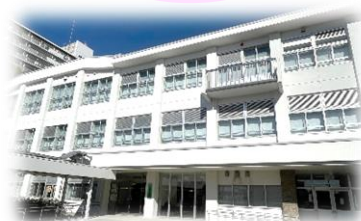
アキシマエンシス 校舎棟 （教育福祉総合センター）