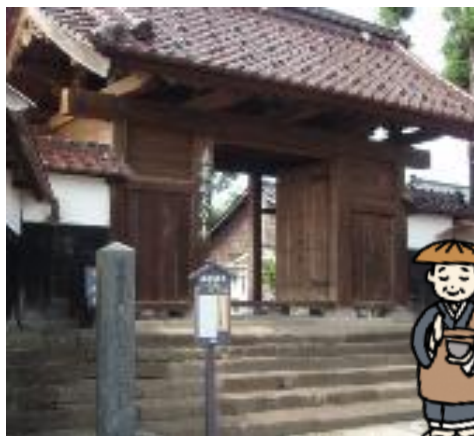
鶴岡市内のお寺「大督

学校給食発祥地である忠愛小学校は、山形県鶴岡市にある大督寺の境内にありました。このお寺のお坊さんが、一軒一軒お経を唱えながら民家を回り、お米やお金などをいただき、お弁当を持参できない子どもたちに昼食を作りました。現在のお寺の住職さんによると、その当時の昼食の魚は、川魚が主流だったそうです。