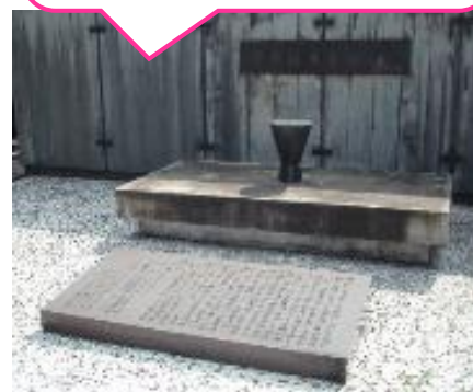
「学校給食発祥の地」の記念碑

昭和34年（1959年）に、学校給食70周年記念式典開催され、お寺の境内に記念碑が建立されました。