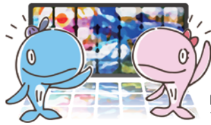
昭島市公式キャラクター アッキー&アイラン

本年度昭島市一般会計予算総額は、563億6000万円のうち約13.8%が教育費に充てられています。