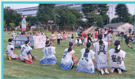
新企画 拝二小ソーランの様子

今回、参加した子どもたちが、未来のリーダーとして成長できる機会になればと思います。