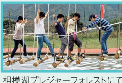
相模湖プレジャーフォレストにて