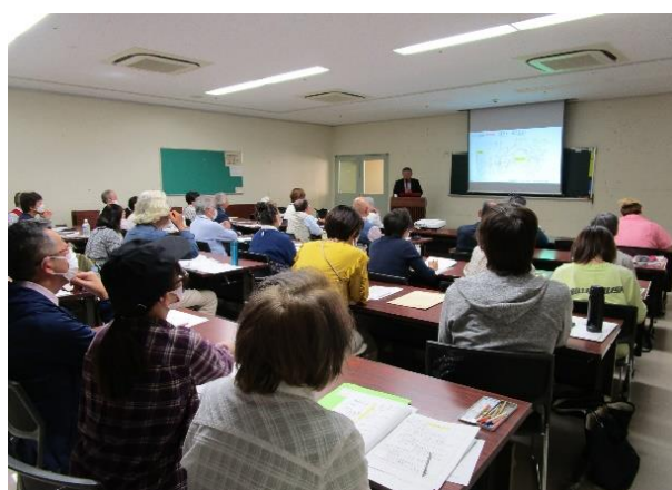
▲ 1 年次学習風景