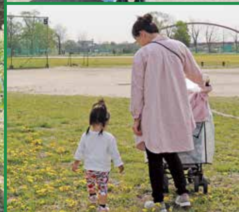
初夏の緑を楽しむ