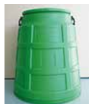
▲生ごみ堆肥化容器

☆詳しくは、ごみ減量係(環境コミュニケーションセンター内) ☎ 546-5300へ。