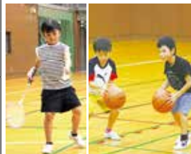
▼表2 総合スポーツセンターの個人利用