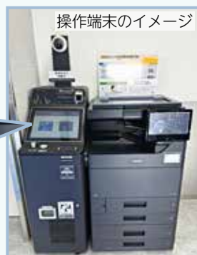
操作端末のイメージ