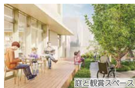
庭と観賞スペース