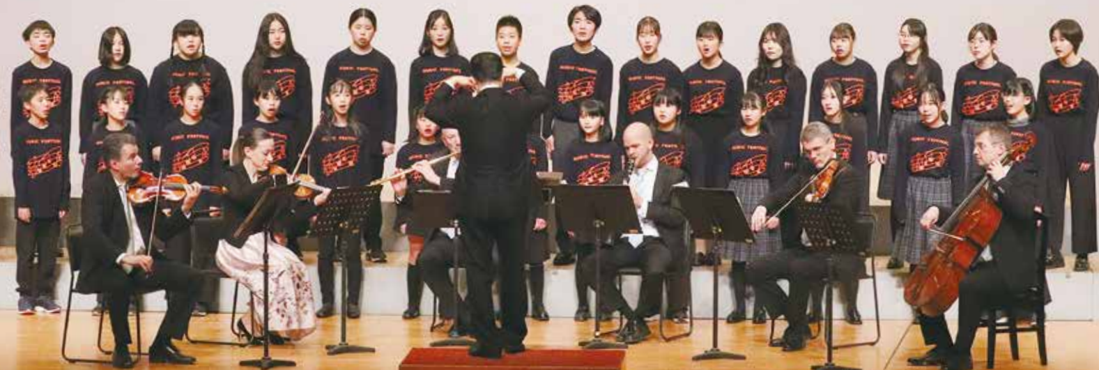
響け、祝いのハーモニー