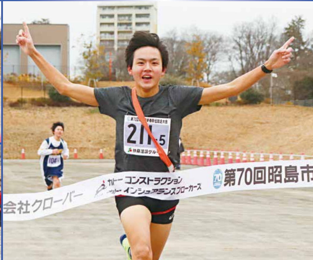
ゴールに向かって