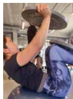
▲厳しいトレーニング