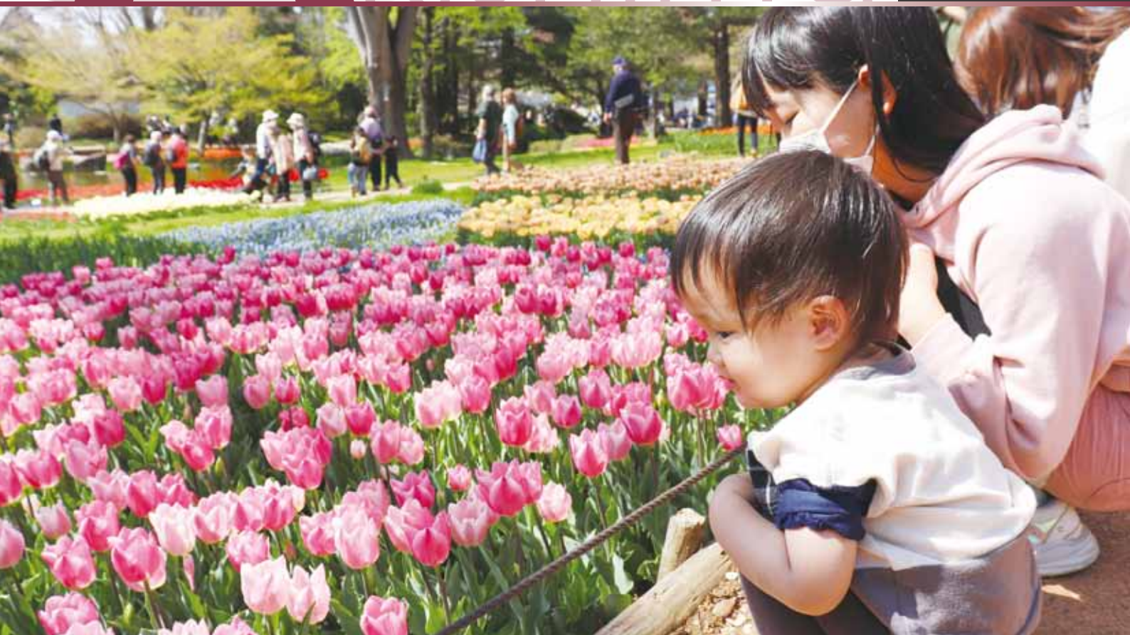
どの色の花が好き？