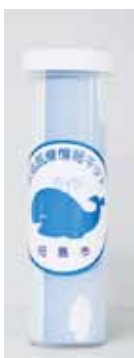
救急医療情報キット

◎救急医療情報キットとは？ プラスチック製の円筒形の 容器の中に、医療情報カード (緊急連絡先、かかりつけ医療 機関、持病、服薬の内容などを 記入したもの)、健康保険証・ 診察券・薬剤情報提供書などの