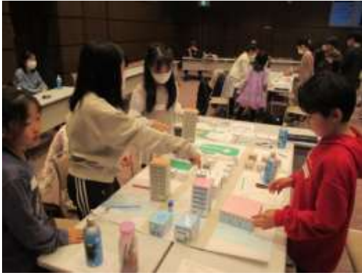
テーマをもとに、みんなでまちづくり