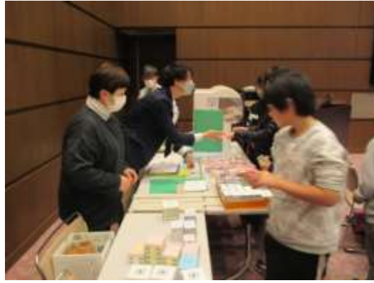
コインで模型を購入