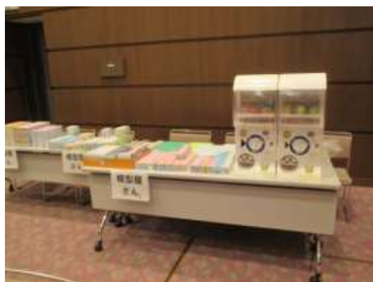
模型屋さん、「まちくじ」ブース