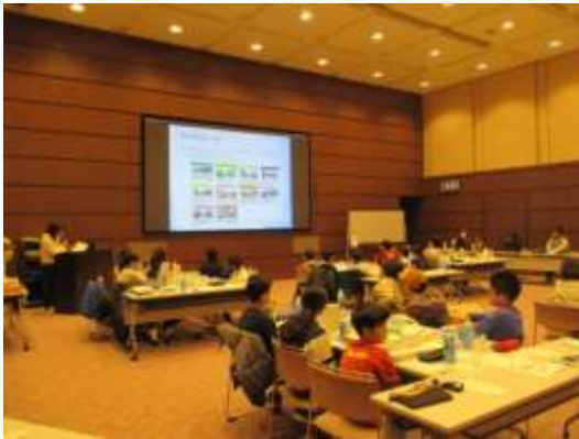
都市計画のルール of 解説