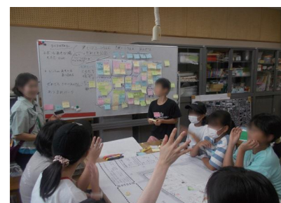
子どもたちからたくさんの意見がありました