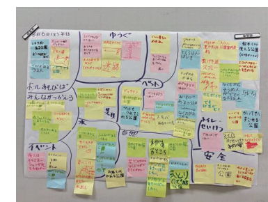
子どもワークショップの成果