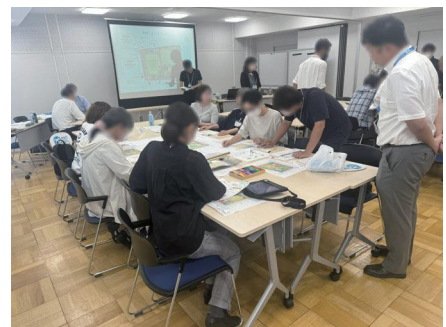
第2回ワークショップのようす