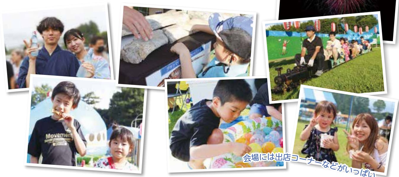
会場には出店コーナーなどがいっぱい

※参加団体は、都合により変更する場合があります。 ※開場前の入場、場所取りはできません。 ※駐車場がありませんので、車での来場はご遠慮ください。 ※自転車は、陸上競技場南側または東小校庭に駐輪してください。 ※会場内(昭和公園、学校施設を含む)は全面禁煙です。 ※陸上競技場は人工芝であるため、くいを打つなどの行為、ハイヒールなどを履いての入場、ペットを連れての入場はご遠慮ください。