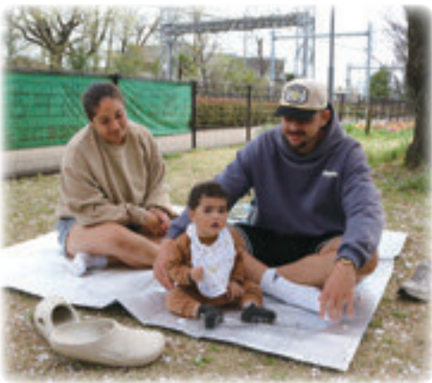
ほかほか陽気でピクニック (エコ・パーク)

質問 医療的ケア児を受け入れて保育施設について、①職員への研修を実施しているのか。②市から研修費用の援助はあるのか。