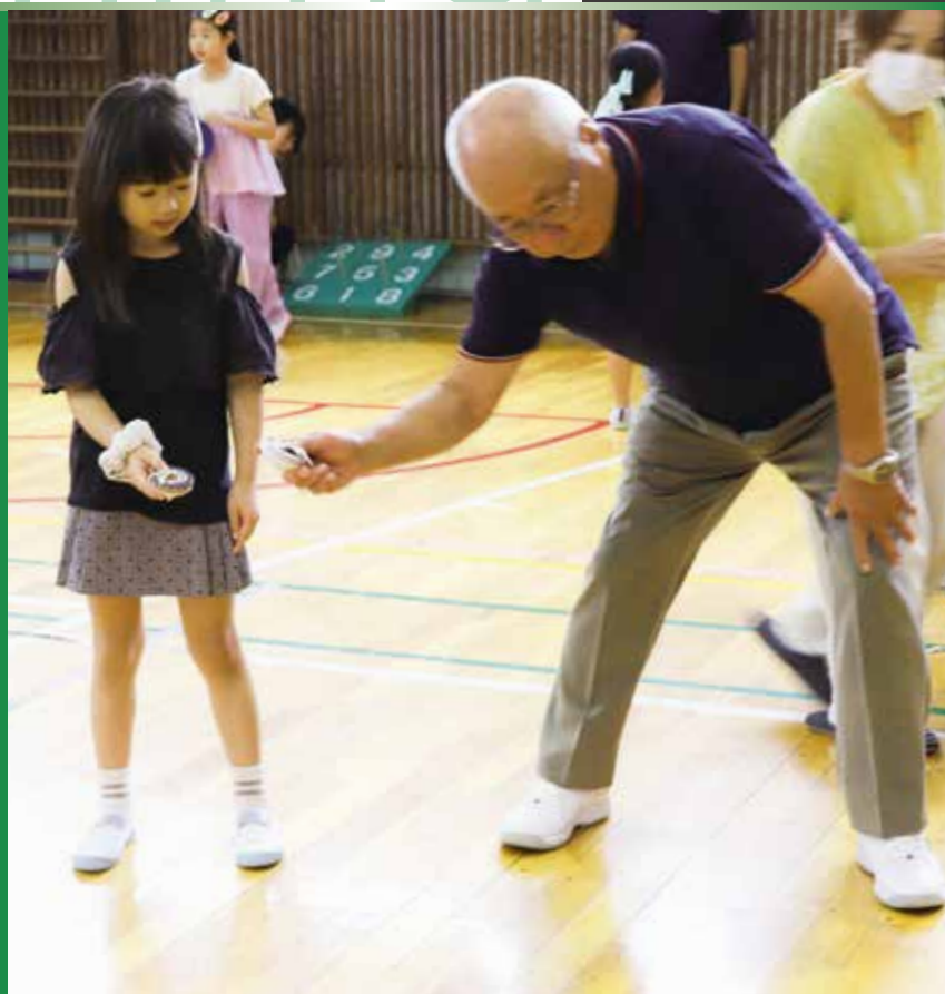
世を超えてみんなで昔遊び