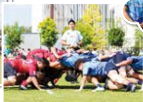
ちかっぱーも応援に行ったよ！