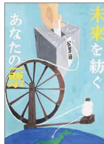
▲中学生の部 最優秀賞作品