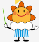
気象庁マスコットキャラクター はれるん