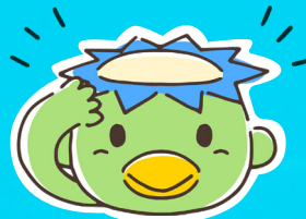
昭島市公式キャラクター「ちかっばー」