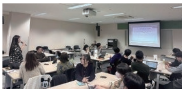
↑ 12月20日(土)第2回若者会議