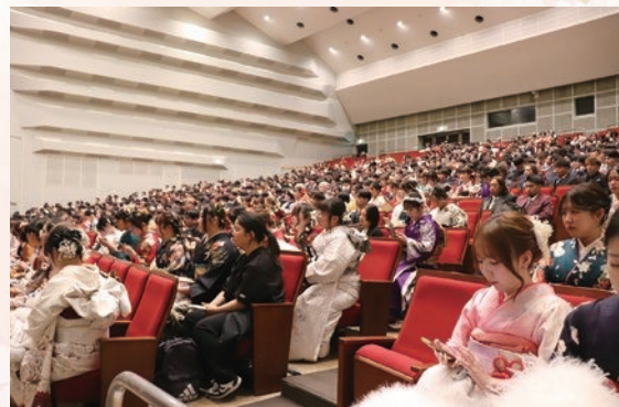
☆詳しくは、社会教育係へ