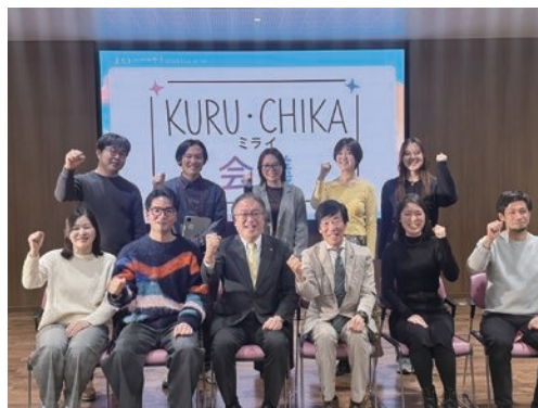
↑ 1月24日(土) 提言発表会