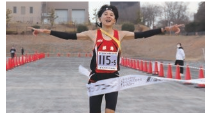
☆詳しくは、スポーツ振興課へ