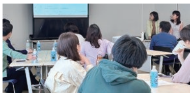
↑ 10月4日(土)オープン講座