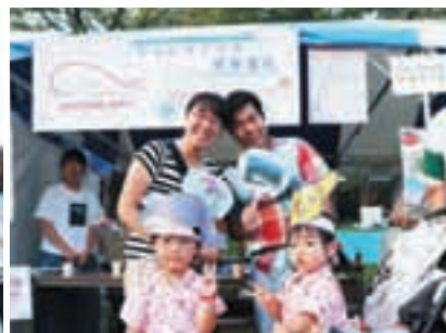
昭島市民くじら祭