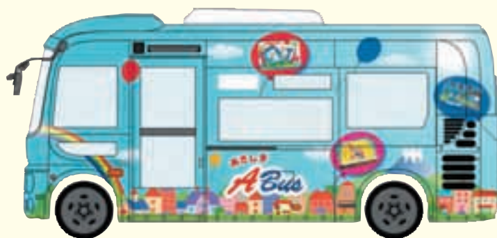
▲車体は各地域の小学生の絵を入れた風船が浮かんでいるデザインです。