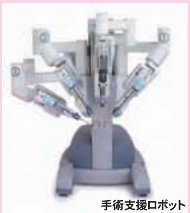
手術支援ロボット