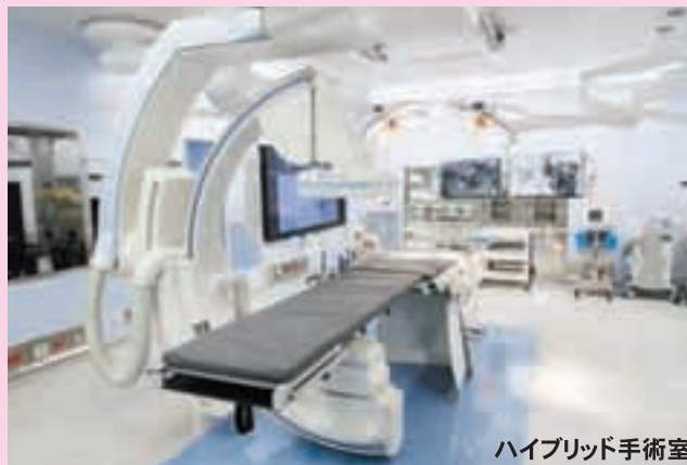
ハイブリッド手術室