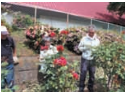
バラの育成ボランティア