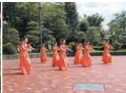
いきいき健康フェスティバル