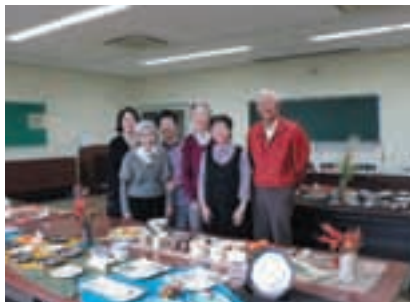
市民文化祭 陶芸展