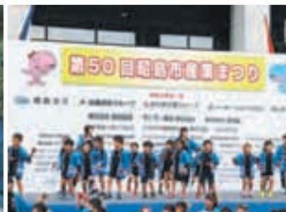
産業まつり ステージ