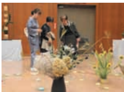
市民文化祭 華道展