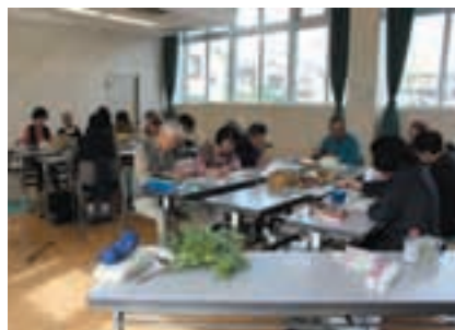
高齢者イキイキ・ニコニコ介護予防教室