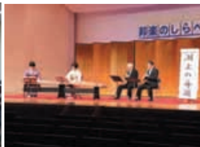
市民文化祭 邦楽のしらべ