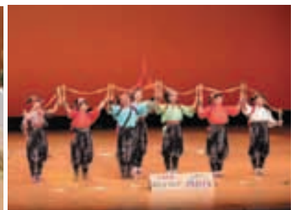
市民文化祭 芸能祭