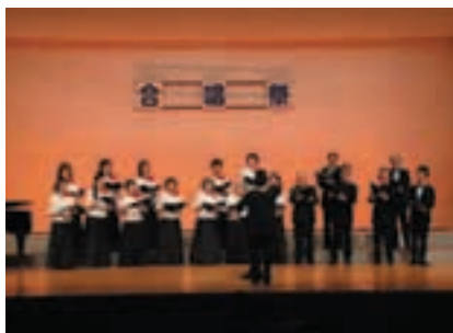
市民文化祭 合唱祭