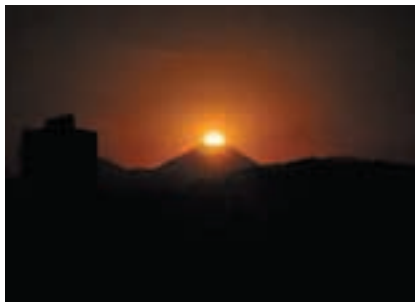
ダイヤモンド富士