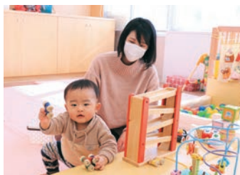
子育てひろばいちご