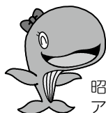
昭島市公式キャラクター アイラン

申し込み不要の催しもあります。館内の掲示、または、市ホームページの「福祉のひろば」から「児童センター」のページをご覧ください。